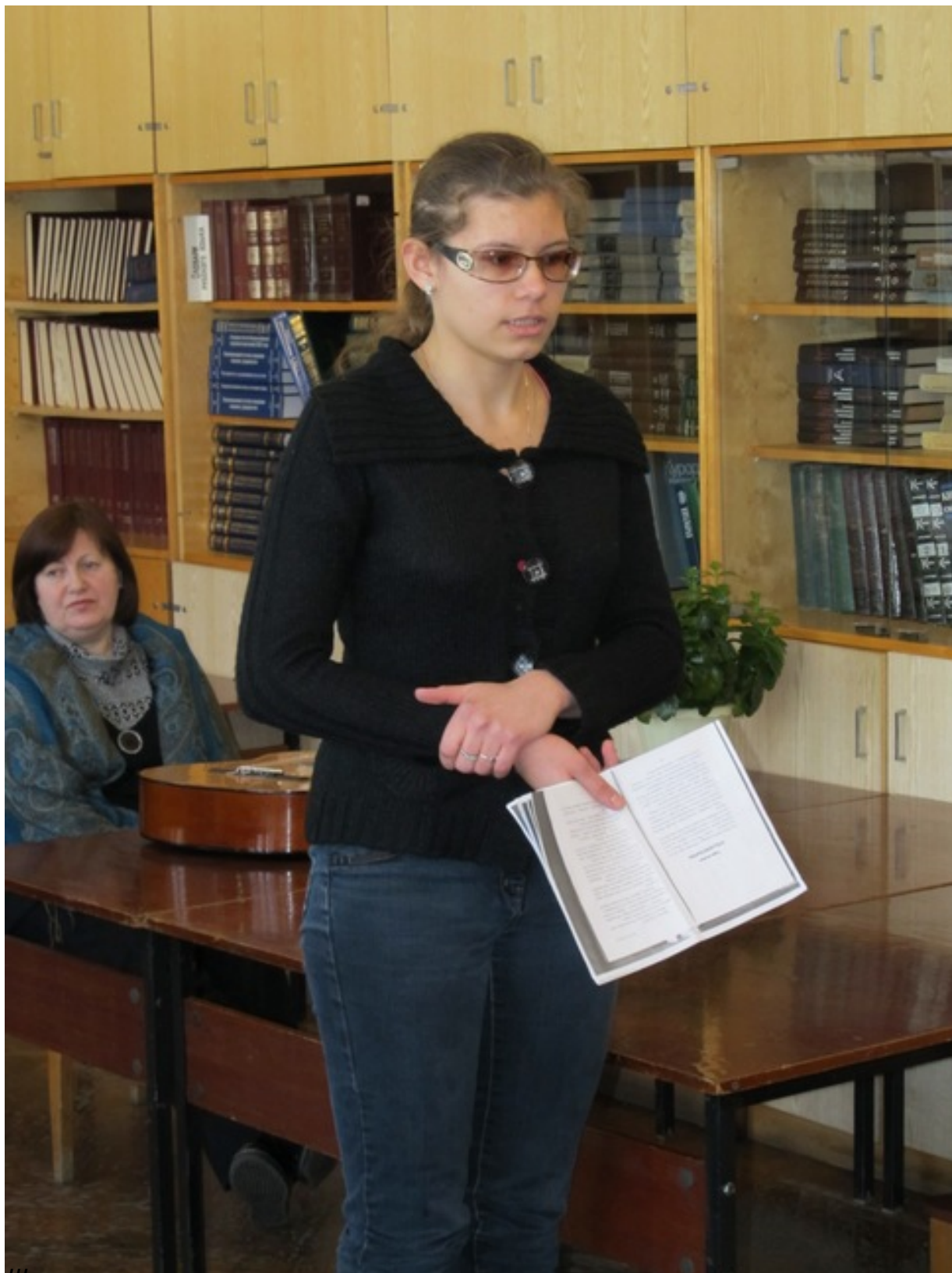
Школьница рассказывает о своих впечатлениях о книге

20.02.2012 12:25 - Обновлено 20.02.2012 12:30